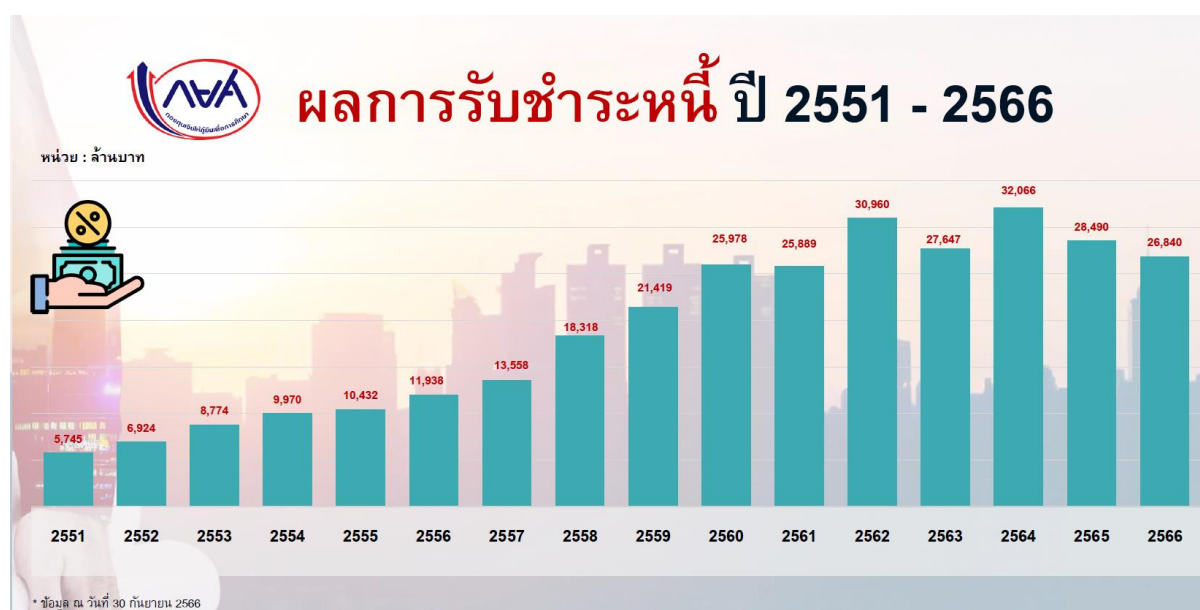
ภาพที่ 4 ผลการรับชำระหนี้

นอกจากนี้ จากภาวะเศรษฐกิจชะลอตัว ผลจากการระบาดของเชื้อไวรัสโควิด - 19 และอัตราการว่างงานสูง ทำให้ความสามารถในการชำระเงินคืนของผู้กู้ยืมเงินกองทุนฯ ลดลง โดยเฉพาะผู้กู้ยืมเงินที่ไม่ได้อยู่ในระบบ ภาษี ระบบการจ้างงาน และผู้ประกอบการอาชีพอิสระ เป็นต้น แม้ว่า กองทุนฯ จะดำเนินการกระตุ้นการชำระเงินคืนและมีการหักเงินเดือนจากองค์กรนายจ้างตามพระราชบัญญัติกองทุนฯ แล้วก็ตาม ประกอบกับกองทุนฯ ได้เริ่มมีการปรับโครงสร้างหนี้ซึ่งมีสัดส่วนการชำระหนี้ต่อรายลดลง และส่งผลการรับชำระหนี้ก็ยังมีแนวโน้มลดลงจนถึงปัจจุบัน ตามภาพที่ 4